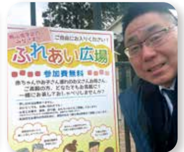
▶ 桃山南ふれあい広場 1/27