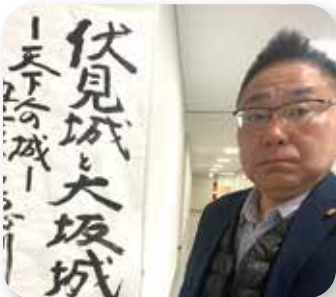
▶ 伏見城講演会 12/24