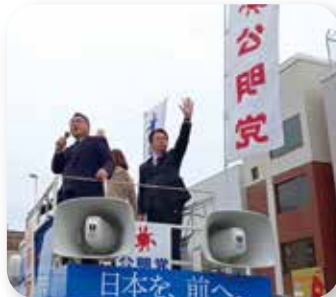
▶ 新春街頭演説会 1/3