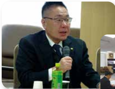
▶ 弁護士意見交換会 12/23