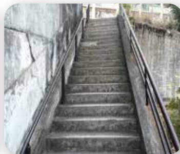
▶ 小栗栖西団地 階段手すり設置