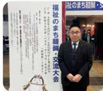
▶ 福祉のまち醜聞交流大会 1/27