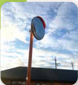
▶ 醜聞新開 カーブミラー新設