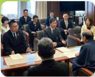
▶ 物価高騰対策緊急要望 11/21