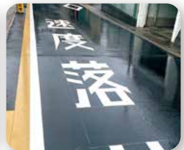
▶ 桃山紅雪町 安全対策