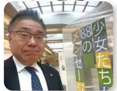
▶ 少女たちのメッセージ展 12/9