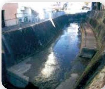
▶ 合場川 しゅんせつ工事