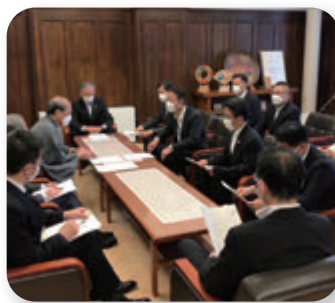
▶ 物価高騰対策緊急申し入れ (5月)