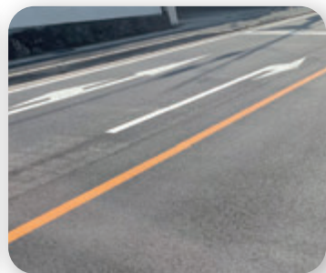
▶ 石田大山交差点 右折レーン設置