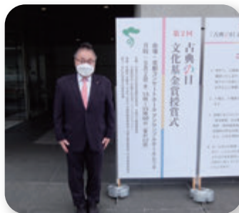
▶ 古典の日授賞式(9月)