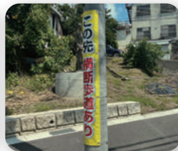
▶ 小栗栖牛ヶ淵町 注意喚起幕