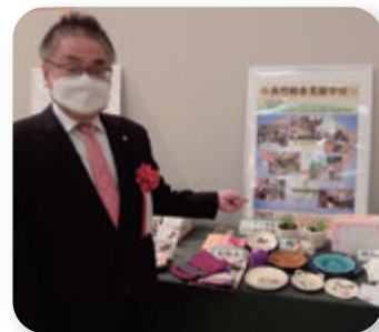
▶ 障害者ワークフェア視察(9月)