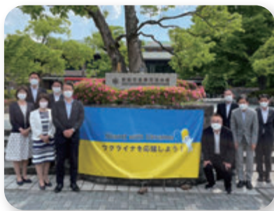
▶ ウクライナ支援ネットワーク視察 (6月)