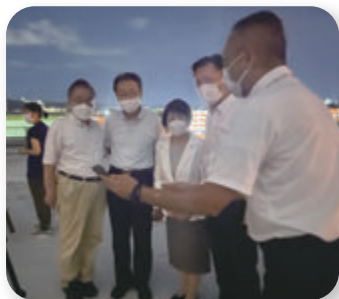
▶ 青少年科学センター 天体望遠鏡視察(7月)