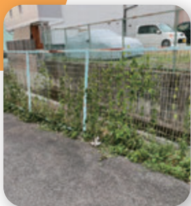
▶ 醍醐模ノ内町 雑草対策