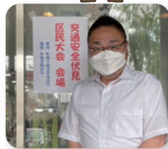
▶ 交通安全伏見区民大会 (6月)