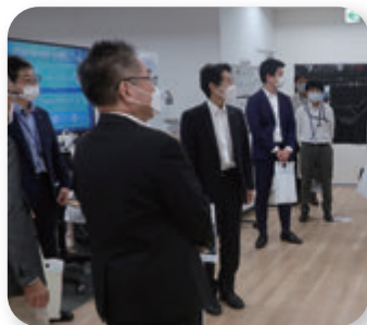
▶ 川崎市の起業家支援拠点視察 (8月)