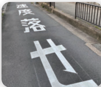
▶ 桃山東学区 通学路安全対策