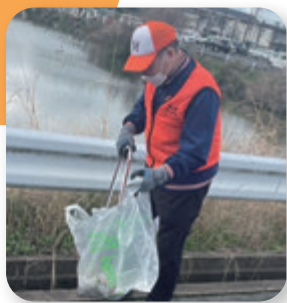
▶ 桃山南学区 清掃活動(3月)