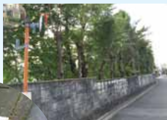
醍醐中学安全対策