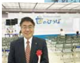
草の根ミーティング