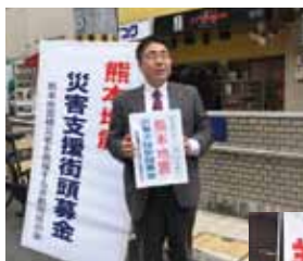
熊本地震支援の街頭募金活動に参加