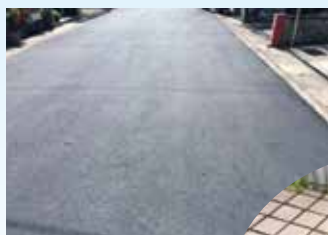
小栗栖森本町道路補修