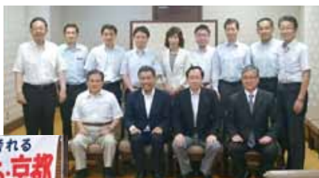
熊野参院議員と意見交換