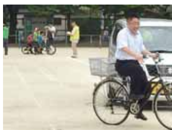
自転車教室に参加