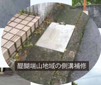
醍醐端山地域の側溝補修