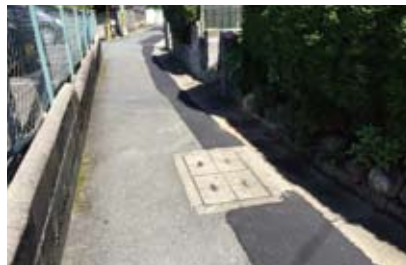
石田大山町交差点北側の坂道を補修