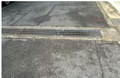
日野谷寺町の側溝を修復

大受団地1棟周辺の山科川堤防にある遊歩道。憩いのベンチが老朽化して大変に危険な状況でした。住民の方の声を届け、キレイに修復することができました。