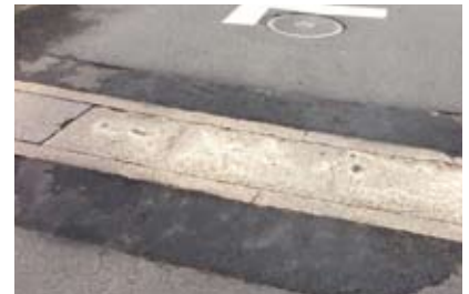
日野谷寺町の危険な段差を解消