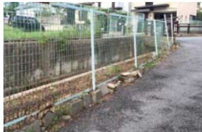
槇ノ内町の川沿いの雑草を整備