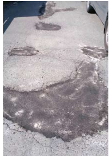
醍醐石田団地南側の道路陥没を修復