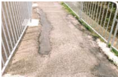
外環さと北側に架かる橋の陥没を補修