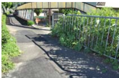
大受団地西側の新石田橋の歩道を補修