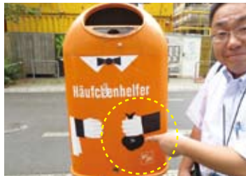
ベルリン市内に設置されている糞処理ポスト (7/29)