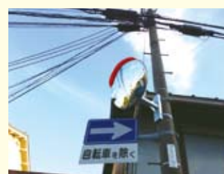
● 千本廬山寺東入る / カーブミラー新設