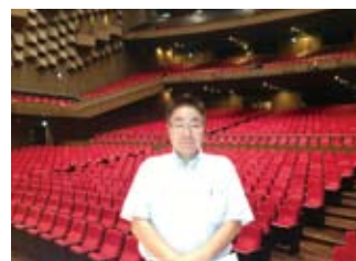
フェスティバルホール視察 (8/6)