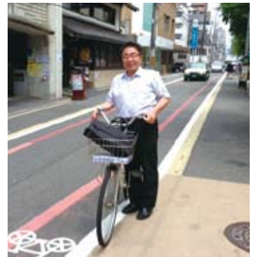
通学路安全対策総点検(6/18)

5月28日の最終本会議で、全会一致で可決成立。自転車条例に続いて公明党主導の“議員立法”が実現したのです。議会改革の先頭に立って頑張っています!