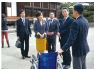
観光ツーリズム視察 (4/14)