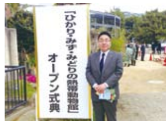
動物園「熱帯動物館」オープン式典 (4/27)