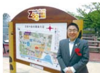
動物園「ツシヤママネコ繁殖施設」オープン式典 (7/6)