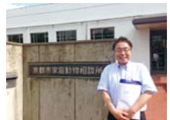
家庭動物相談所視察 (6/27)