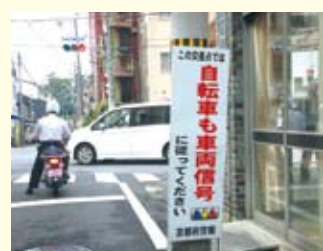
● 丸太町通り / 歩車分離信号周知看板