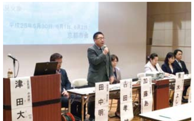
議会基本条例説明会(5/30)

60名以上の方々がご参集くださり、熱心に耳を傾けて頂きました。議会報告会や政策立案の充実など、“市民から見える議会”を目指し具体的に推進してまいります。