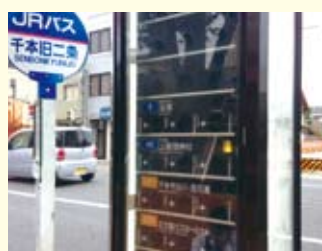
● 千本旧二条 / バスロケーションシステム