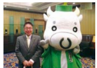
上京区役所整備事業起工式典 (8/11)