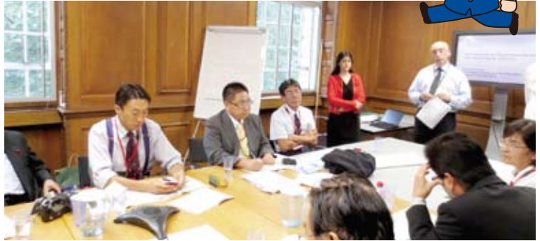
イギリス環境食料農事省(DEFRA)で意見聴取 (8/2)