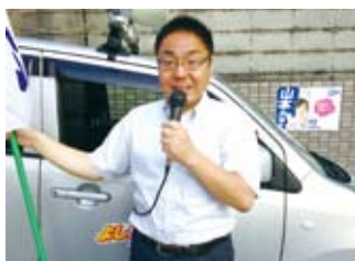
区内10ヶ所で街頭演説 (7/3)