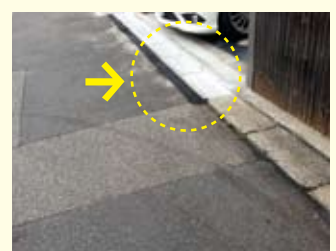
● 仁和学区 / がたついた側溝を補修