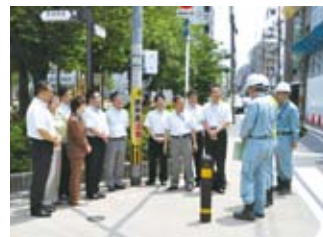
通学路安全対策総点検 (6/18)