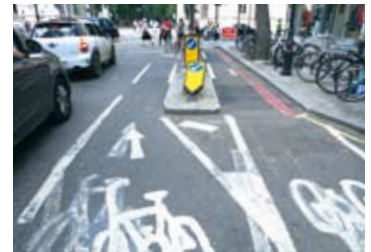
ロンドン市内の自転車レーン (8/3)