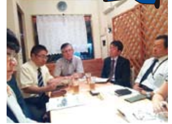
NPOの方々との意見交換(10/2)