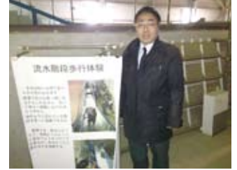
京都大学防災研究所を視察(1/10)