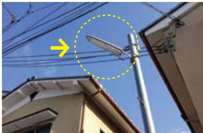
● 乾隆学区/街灯修理