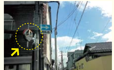
● 仁和学区/カーブミラー設置