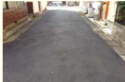
● 京極学区/道路補修