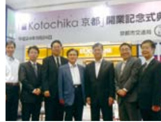
コトチカ京都開業式典(9/24)