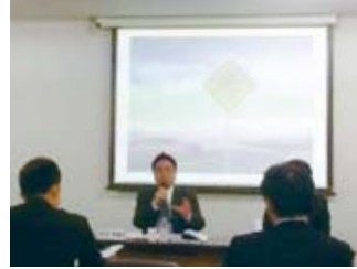
東京の自転車フォーラムで講演(11/14)