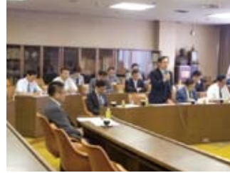
西陣織工業組合と意見交換(9/20)