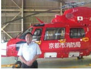
消防ヘリで市内を視察(8/23)