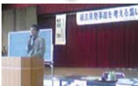
宇治市の講演会に参加(4/29)