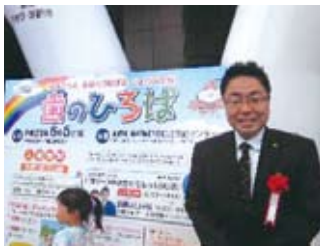
歯科医師会主催「歯のひろば」 に参加(6/5)

防災・危機管理・ライフライン・公営企業などを所管する京都市会交通水道消防委員会の委員長として頑張っています。歯の最新治療技術を学んだり、防災総点検会議を傍聴するとともに、全国で開催される研修会に積極的に参加。災害に強い自治体のデータ処理等の最新技術(クラウド)を研さんするため東京で開催のセミナーに参加し、自治体トップマネジメントセミナーでは北川正恭氏(元三重県知事)の講演を学びました。