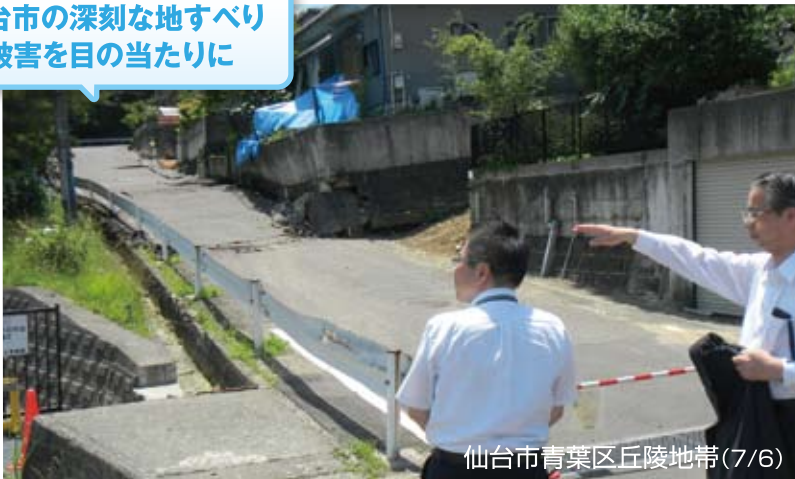
仙台市青葉区丘陵地帯(7/6)