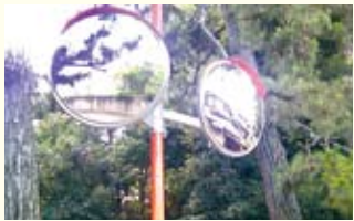
【寺町通り荒神口上がる】 カーブミラーを設置