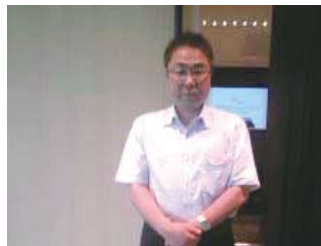
東京で開催のクラウドセミナー で学ぶ(7/1)