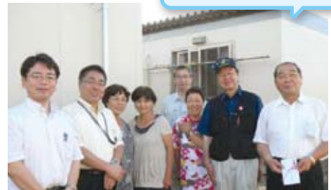
仙台市若林区仮設住宅にて(7/5)