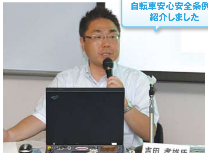
東京で開催の議会活性化セミナーで講演(7/2)