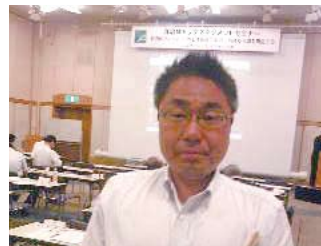
東京の自治体トップマネージ メントセミナーを受講(7/7)