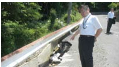
青葉区のガードレール陥没地点(7/6)