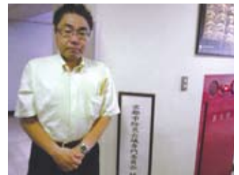
京都市防災会議専門委員会 を傍聴(7/13)