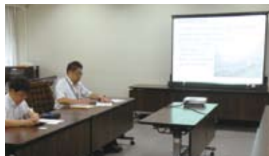
市役所で復興ビジョンを学ぶ(7/6)