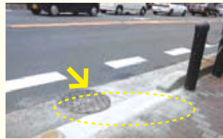
【千本出水バス停】 歩道ブロックの段差を解消