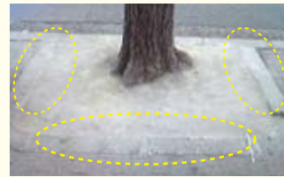
【北野天満宮バス停付近】 樹木にあった段差を解消