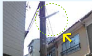
嘉楽学区 街灯新設