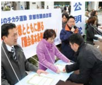
議会基本条例街頭署名活動(1/23)