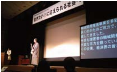
障がい者就労シンポジウム (1/29)