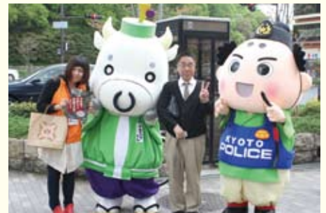
自転車マナーキャンペーン (4/27)

烏丸今出川で開催されたキャンペーンに参加。ゆるキャラと共にマナー向上を呼びかけました。