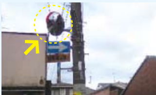
出水通松屋町 カーブミラー設置