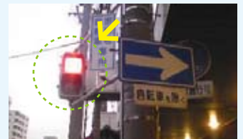
堀川商店街 歩行者信号機設置