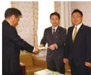
署名簿を市会議長に提出(2/25)