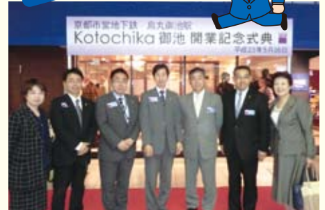
コトチカ御池視察 (5/16)

駅ナカビジネス第2弾。コトチカ御池完成! 議員団代表と共にオープニングに参加しました。