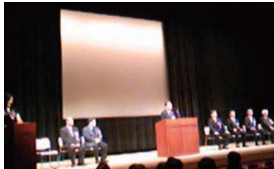
環境フォーラムきょうと (2/26)