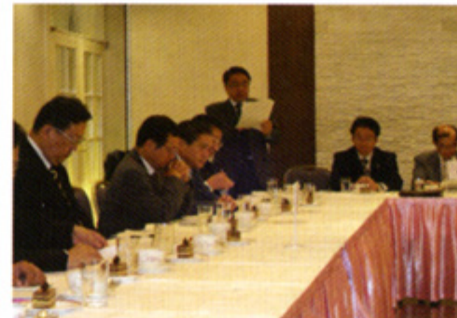
京都商店連盟との意見交換会(10/19)