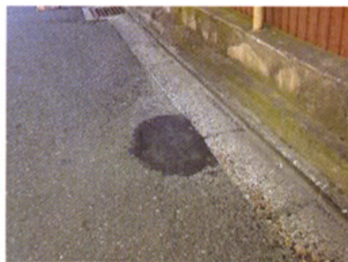
室町上御霊の道路陥没を補修