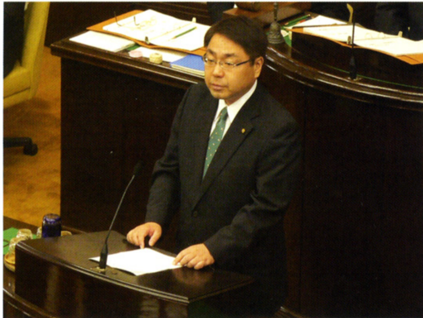
本会議で登壇し、条例案を提案説明しました(9月15日)