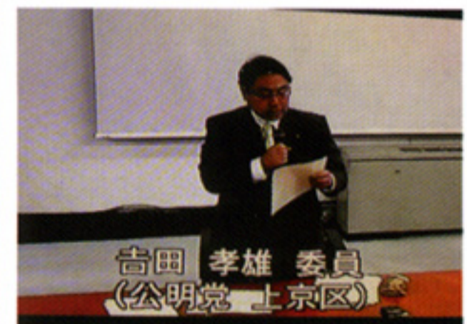
普通決算特別委員会で市長に政策提言(10/20)