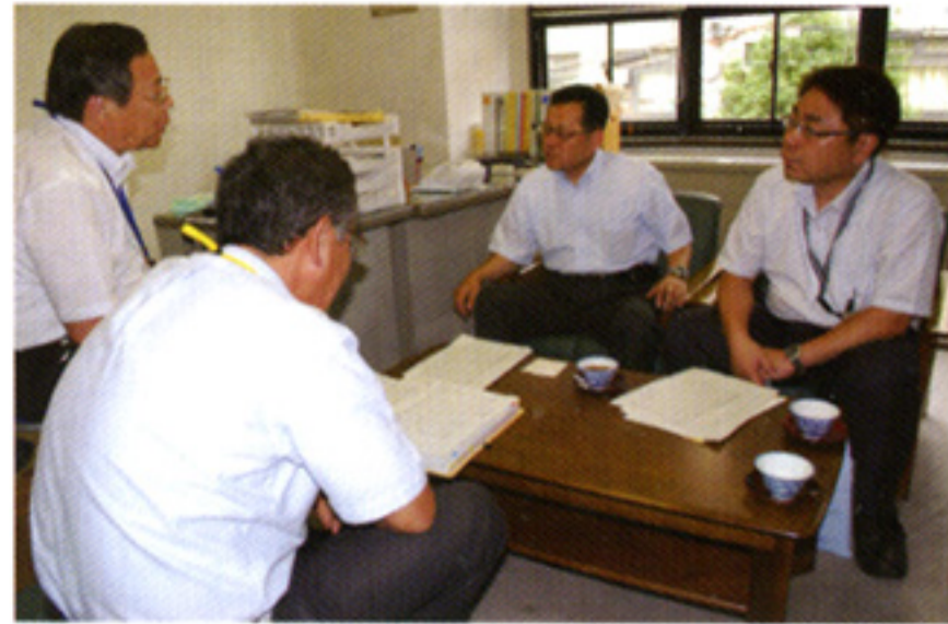
児童福祉センターを視察。児童虐待等について意見交換(9/14)