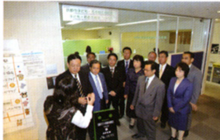
青少年サポートセンターを視察(10/19)