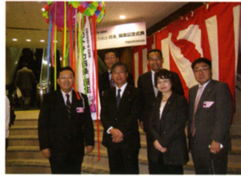
駅ナカビジネスが大きな一歩! 地下鉄四条駅開業式典(9/30)