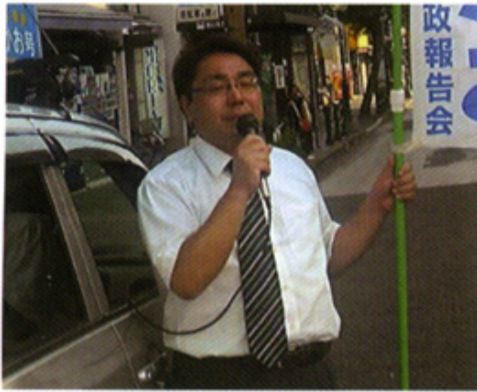
終戦の日を記念し、平和を誓う街頭市政報告会(8/15)