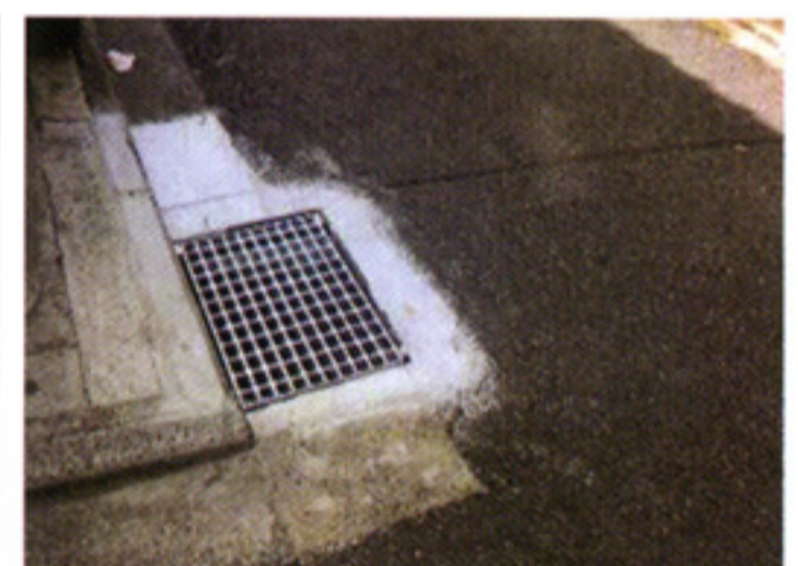
猪熊一条上るの側溝を修復