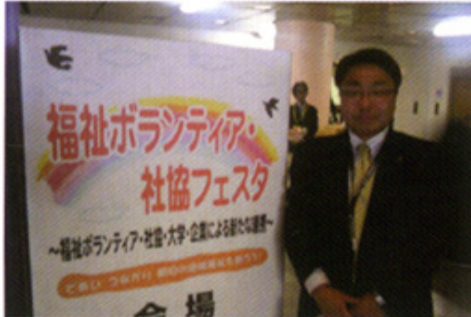
福祉ボランティアフェスタを視察(10/17)