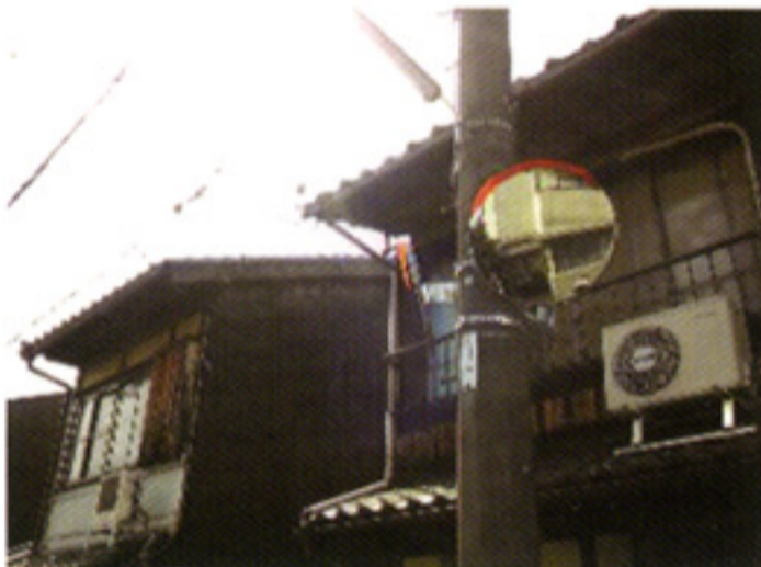
相国寺門前町にカーブミラー設置