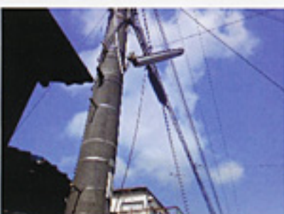
出水学区の街灯を補修