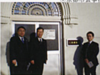
静岡県三島市の環境先進事例を研さん(1/15)