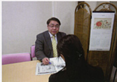
子育て総点検活動にも挑戦 働くお母さんから聞き取り調査