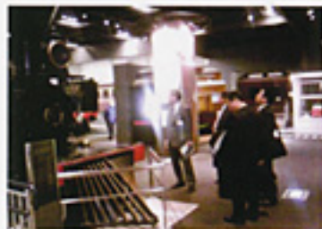
議員団出張で、さいたま市鉄道博物館を視察(1/14)