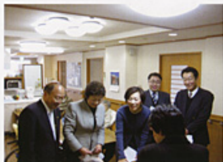
特別養護老人ホームを訪問し 介護現場の声を詳しく取材