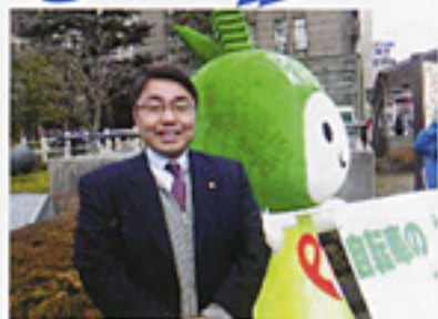
自転車マナーアップキャンペーンで街頭PR活動に参加(2/16)