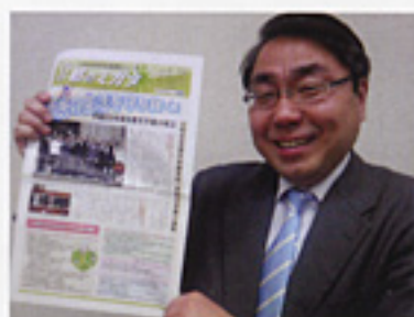
公明党京都市議員団ニュース「京都のミカタ」第3号を発行(3/31)