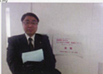
京都市母子福祉センターでひとり親支援を見学(2/21)