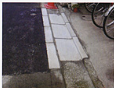
室町学区のお宅の側溝修復