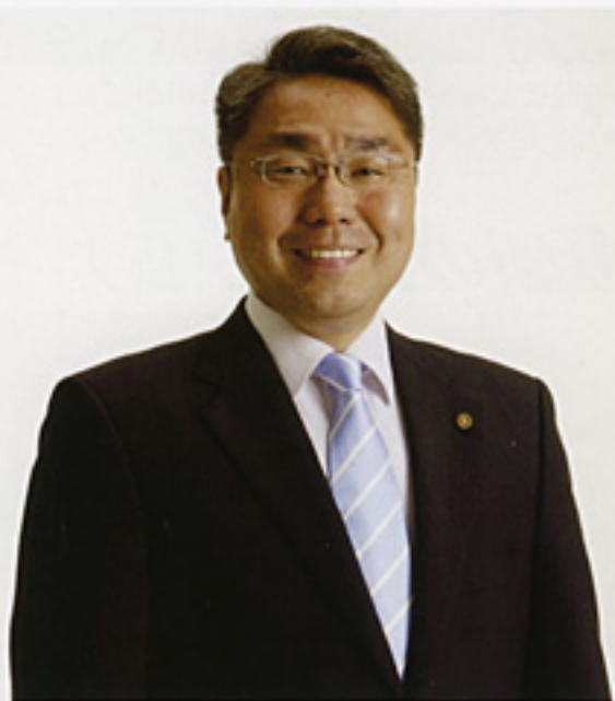
教育福祉委員会所属となりました

公明党京都市会議員団は、全国3,000名の地方議員と“草の根ネットワーク”を結び、「介護総点検」「子育て総点検活動」に、全力で取り組み、政策提言を重ねています。