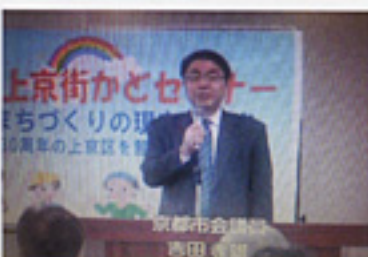
第3回上京街かどセミナーに113名が参加(2/24)