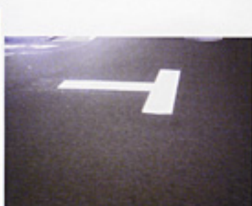
大宮通りの事故多発地点の白線を見やすく!