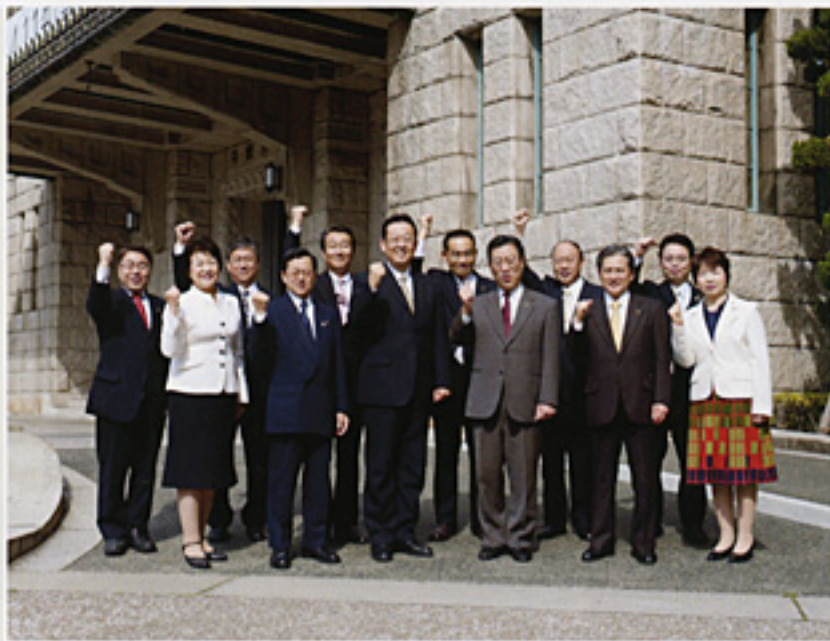
平成22年度をスタートした市会議員団