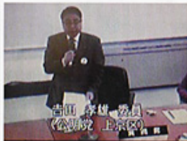
公営企業予算特別委員会で市長に政策提言(3/8)