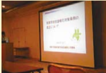
地球温暖化対策意見交換会に参加(7/24)