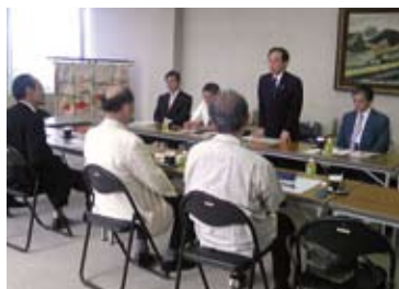
西陣織工業組合意見交換会