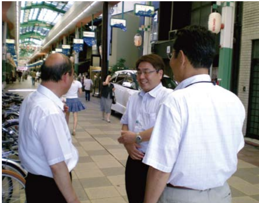
商店街総点検運動