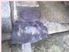
千本一条東の路地を修復