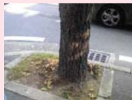
出町商店街の歩道をきれいに