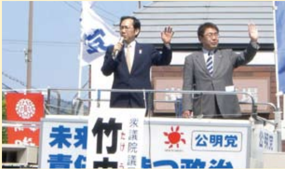
ゴールデンウィーク街頭演説会(5/2)