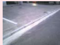
堀川上立売西の老人施設前のガタガタを修復