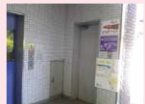
地下鉄蹴上駅の案内板を新設