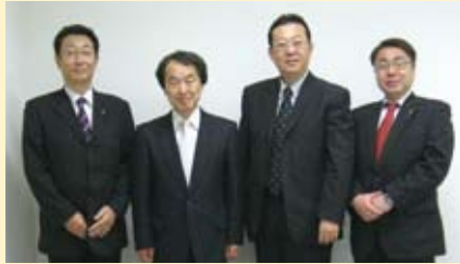
動物愛護セミナーで吉田帯広畜産大学副学長と(5/31)