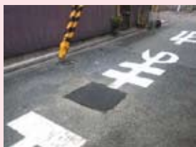
小川武者小路の陥没を修復