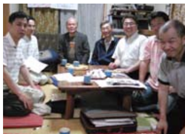
室町学区壮年懇談会

10月からは、3人乗り自転車レンタル事業が開始されることも決定しています。これからも、現地現場主義の活動で培った価値的な政策を創造していくこと、決意を新たにしています。