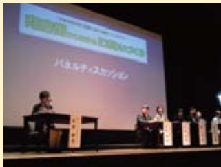
商店街振興シンポジウムに参加(5/9)