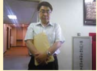
障害者就労支援審議会を傍聴(6/10)