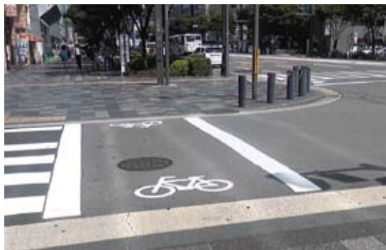
自転車レーン現地視察