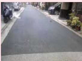
小川学区の道路がきれいに