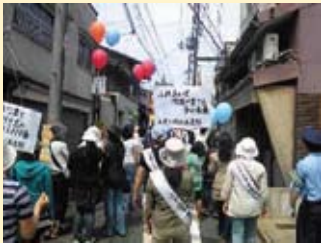
出水学区少年補導パレード(7/10)