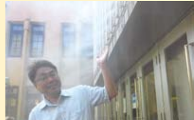
京都国際マンガミュージアムのミスト装置を視察(8/3)