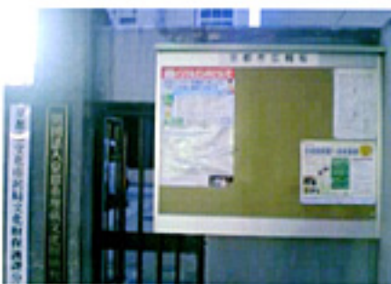
考古資料館前の掲示板改修