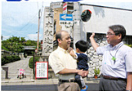
千本駅迎送堂前の通学路にカーブミラー