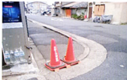
仁和学区の歩道修復