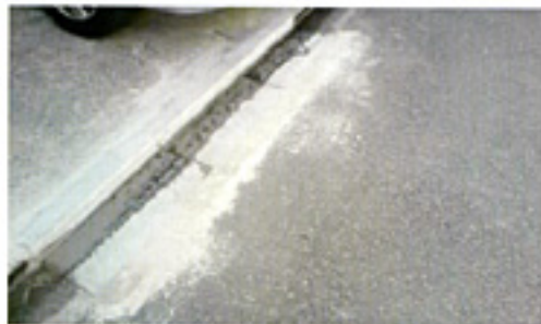
京極学区のお宅前の側溝補修