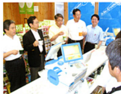
市役所内にエココンビニ開設(6.23)