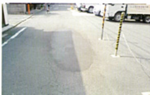
小川学区の道路補修