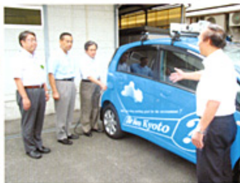
電気自動車を先行導入(9.2)