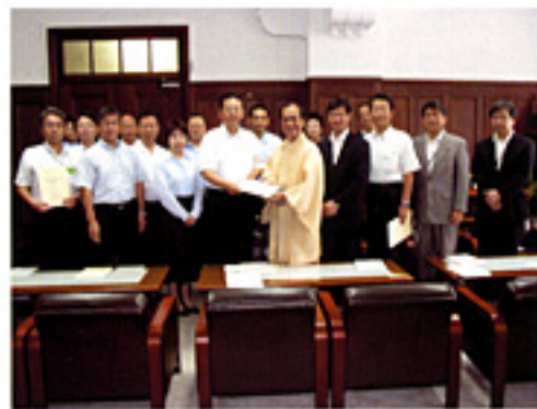
景観政策を市長に提言(7.29)

連絡先 自宅：電話&FAX(075)812-8948 メール：yoshi-dash@m8.dion.ne.jp