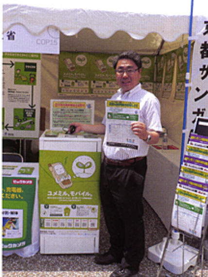
携帯電話回収ブースにて(5/31)

京都市は、6月8日から7月7日まで、 上京区役所 はじめ市内15ヶ所で、 携帯電話リサイクル回収ボックス を設置するキャンペーンを開始すると発表しました。