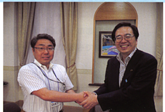
公明党の斉藤環境大臣(右)とガッチリ握手!

京都議定書 の舞台である京都の公明党市会議員の1人として、使命の大きさを改めて実感しました。