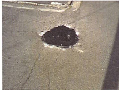
〔出水学区小山町の道路陥没を修復〕