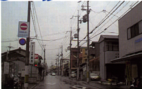
〔御前上ノ下立売に進入禁止の標識を設置〕