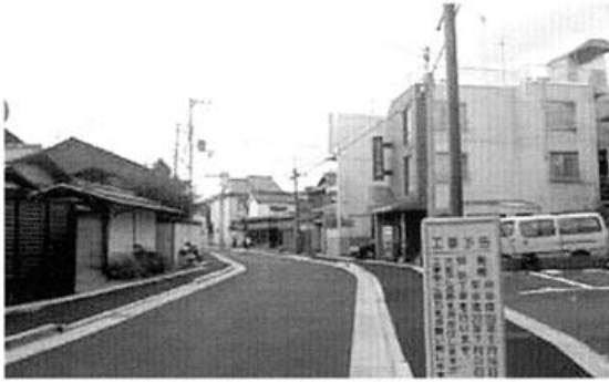
寺町今出川～鞍馬口がキレイに!