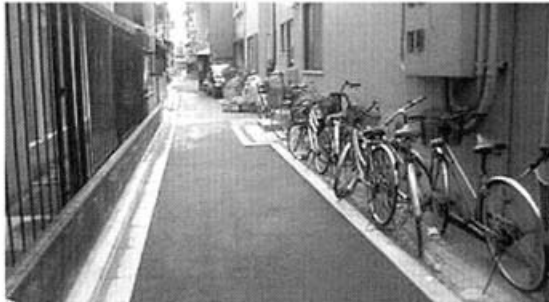
考古資料館東側の道もキレイに!