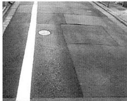
千本出水東の連続水漏れを解決へ!