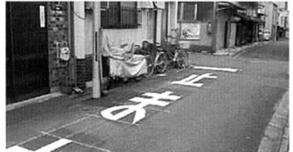
大宮上御霊西の交差点に止まれ表示