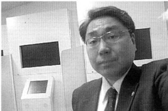
歴史資料館の映像コーナー改修が実現