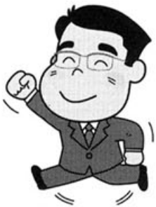
だっしゅしました!