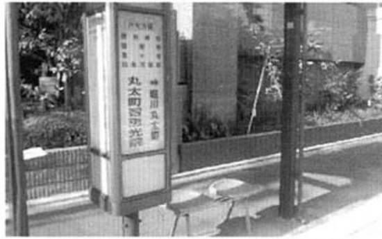
丸太町智恵光院バス停にベンチ設置!