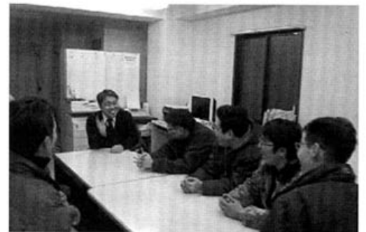
2月13日は事務所で13名の青年と懇談