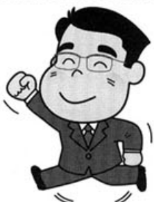
庶民の目線ががんばります!