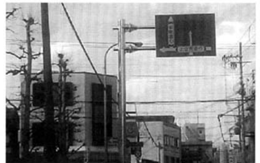
道が分かれている新町通りに看板設置