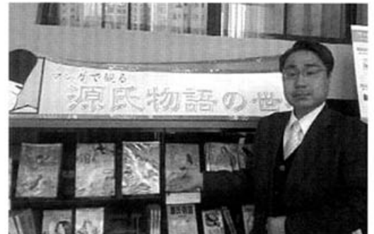
国際マンガミュージアムに常設展も