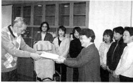
相馬理事長から表彰状を送られました。