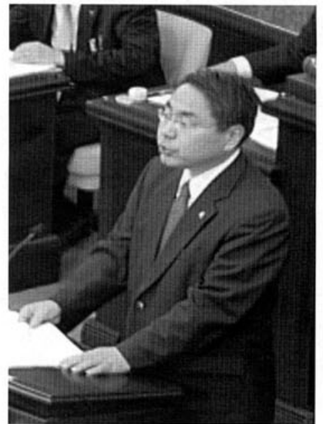
(市議会本会議場にて初登壇)