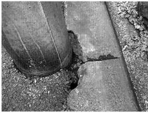
(出水通土屋町上の電柱です)