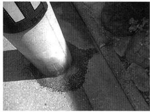
(腐食の危険があった根元を修復)

当選させていただいてから、はや2ヶ月。50件以上の市民相談を寄せていただきました。期待と信頼の何よりの証拠と、感謝で一杯です。